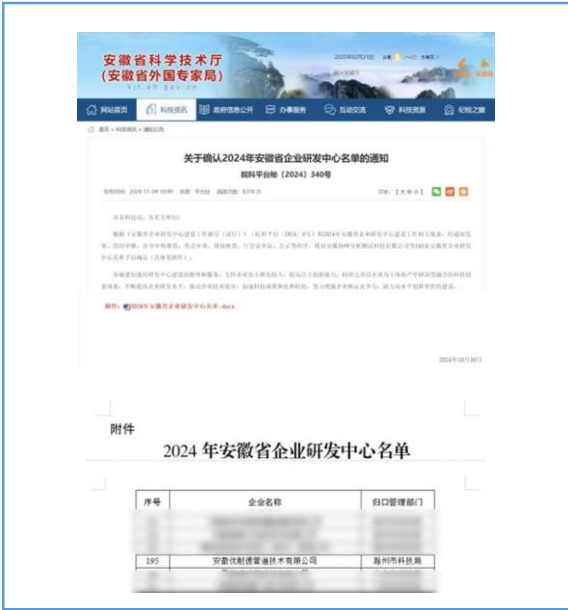
2024年10月，子公司安徽优耐德管道技术有限公司，获评“安徽省企业研发中心”。