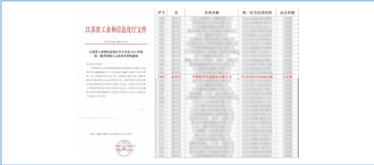
2024年12月，公司获评江苏省2024年度第二批省五星级上云企业。